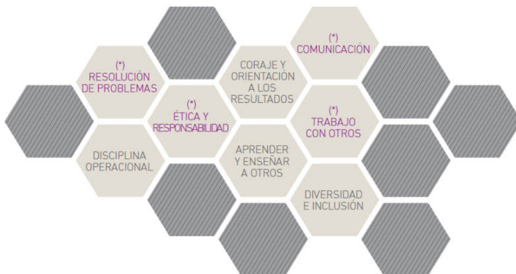
Esquema de las Competencias Conductuales para la Minería (1):

Con el fin de favorecer su incorporación en procesos de formación, se presenta a continuación la definición de cada competencia y los descriptores correspondientes a este Nivel de Cualificación del MCTP.