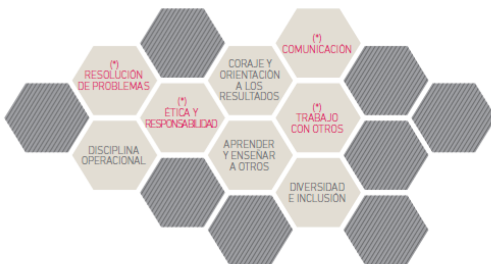
Esquema de las Competencias Conductuales para la Minería (1):

Con el fin de favorecer su incorporación en procesos de formación, se presenta a continuación la definición de cada competencia y los descriptores correspondientes a este Nivel de Cualificación del MCTP.